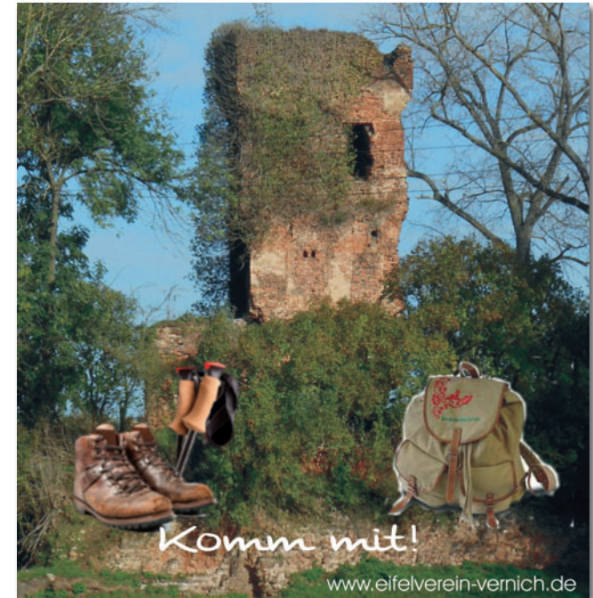
Turmruine Burg Großvernich